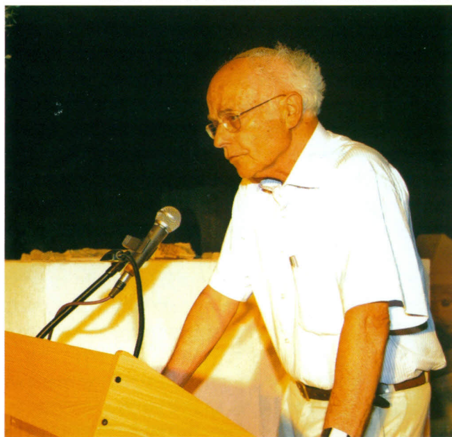
"אימצנו גישה פתוחה - שותפות של מחפשים".

"בכיתתי שבבית הספר בירושלים החל כל שיעור בדקות משעממות עד מוות שבהן בחן המורה אם כל אחד מ-25 התלמידים שינן כראוי את הפסוקים מספר הושע, שלשונם ותוכנם היו נשגבים מבינתנו. אני מודה שבזמנו שנאנו זאת, אך כיום אני רוחש תודה עמוקה לאותו מורה, שבזכותו טבועים הפסוקים בתת הכרה שלי ומזינים את רוחי, את נפשי ואת עבודתי. הגיע הזמן לשוב לשינון מבוקר ומוגבל, וחשוב לעשות זאת בגיל המתאים, שכן ילדים קטנים אוהבים מאוד ללמוד בעל פה".